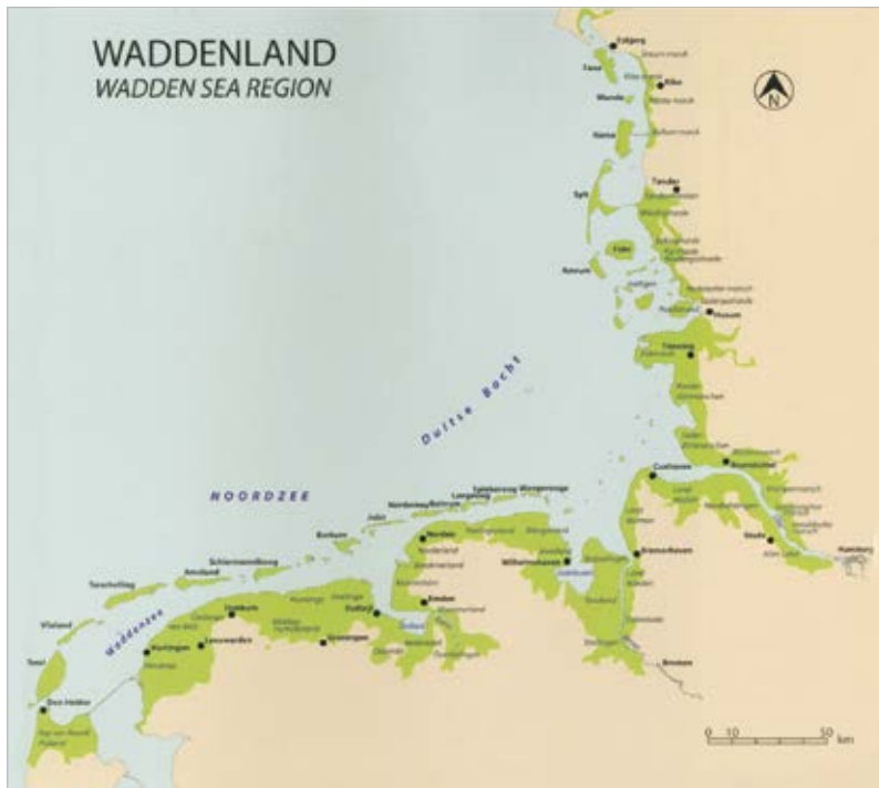
De begrenzing van Waddenzee en Waddenland in internationaal perspectief (uit: Schroor 2008).

en bedijkte kwelders, zet zich net als de reeks eilanden over de grens met Duitsland voort tot in Denemarken. De Waddenzee zelf bestaat uit een voortdurend wisselend samenstel van geulen, prielen (smalle geulen), platen en slikken. Zij heeft ten oosten van het Friese Zwarte Haan geleidelijk een uit kwelders bestaande overgang met het vasteland, maar bespoelt in het westelijke Waddengebied direct de zeedijken.