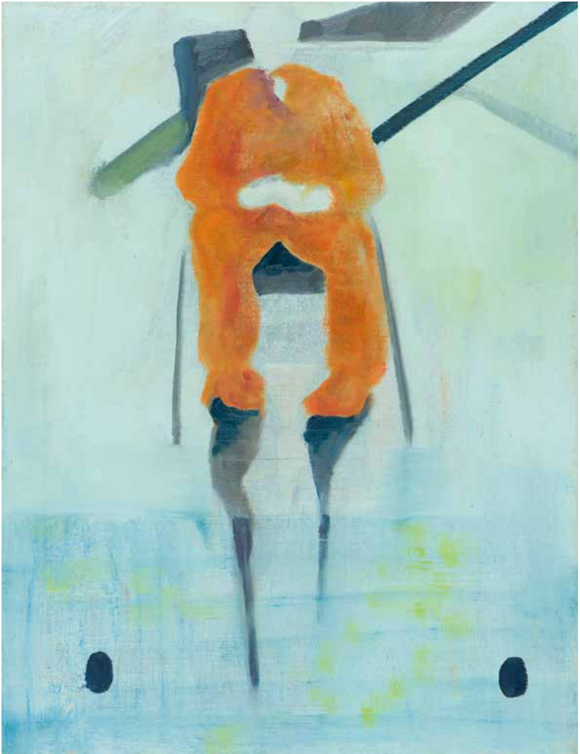
1 Impasse , 2006 olieverf op linnen, 65 x 50 cm. collectie Marianne Wols, Leeuwarden