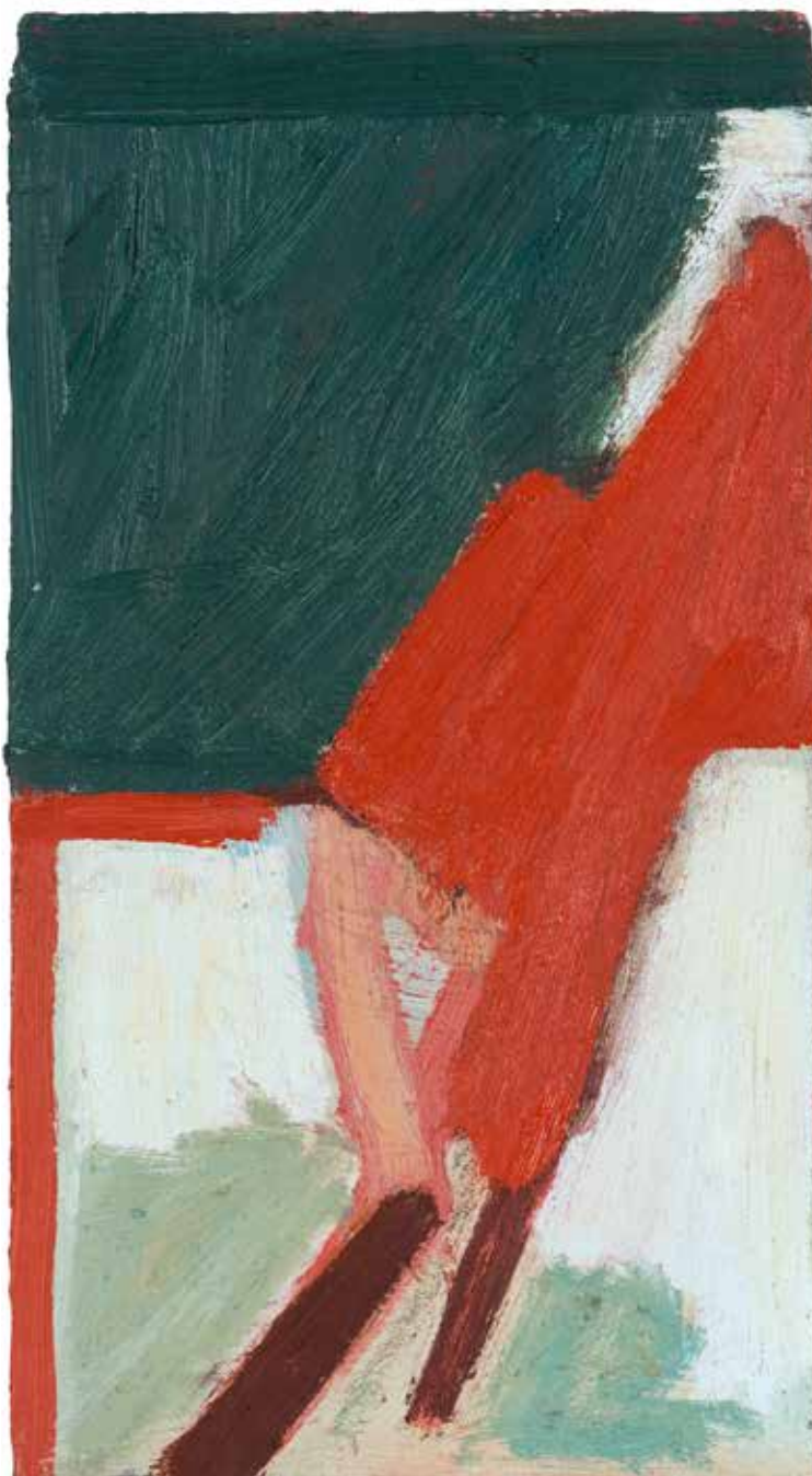
92 Stadsfragment , 2009-2010 olieverf op paneel, 35 x 20 cm. Museum Belvédère