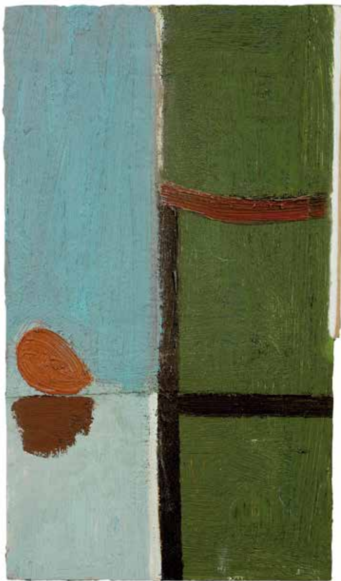
94 Stadsfragment , 2008-2009 olieverf op paneel, 29 x 17 cm. particuliere collectie