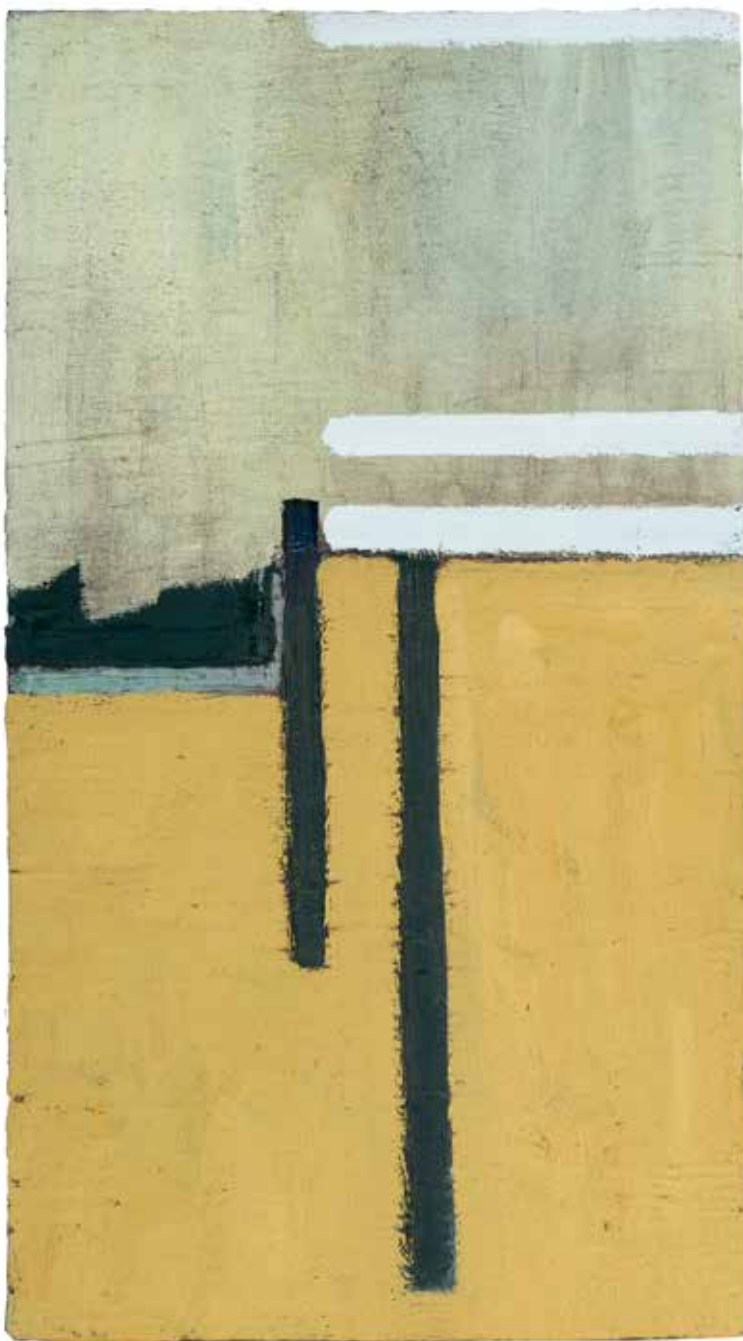
93 Stadsfragment , 2009-2010 olieverf op paneel, 35 x 20 cm. Museum Belvédère