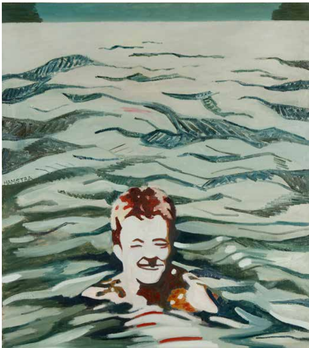
84 Het mooie leven (no. 47/52), februari 2011 olieverf op linnen, 90 x 80 cm. collectie Klerk / Van Gelderen