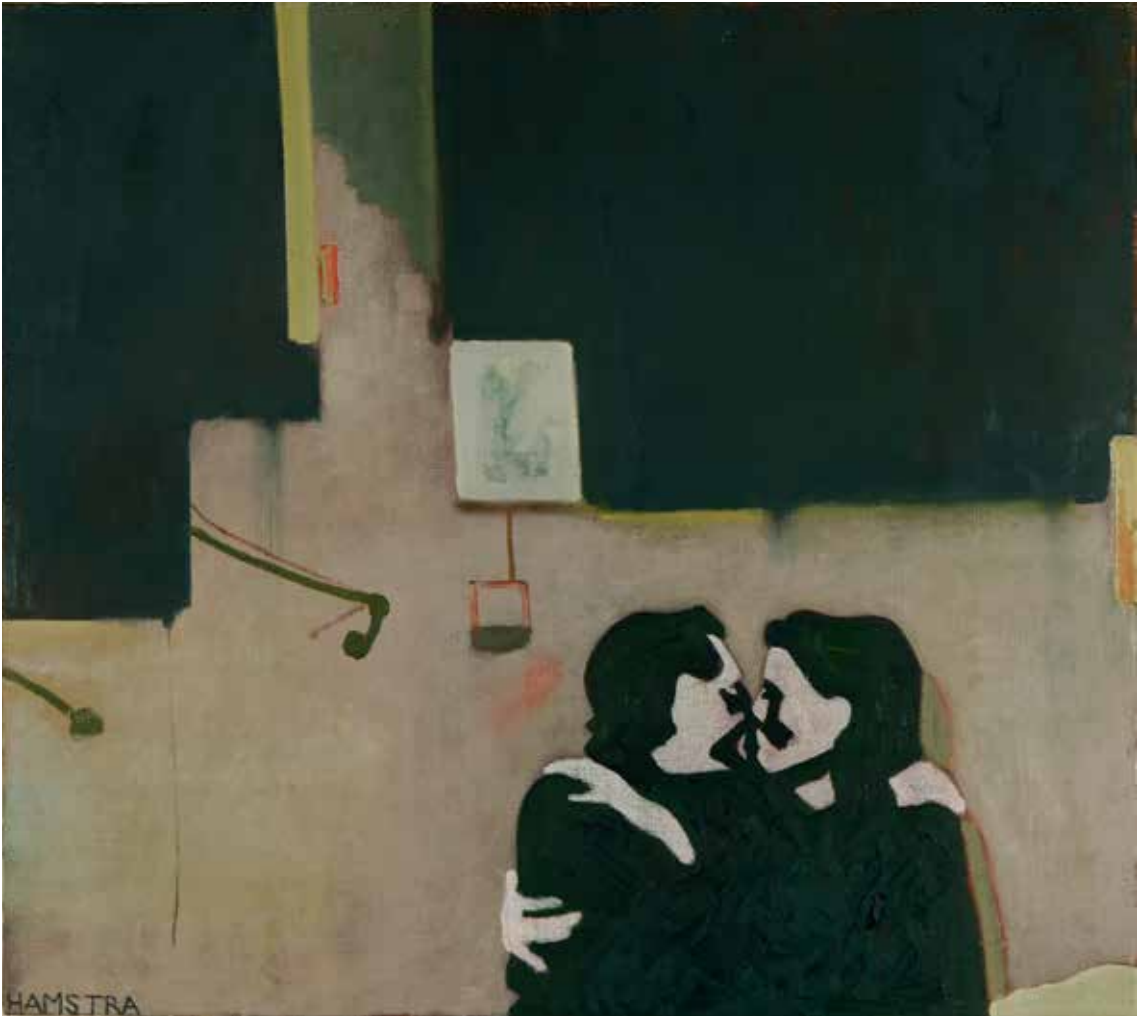
85 Het mooie leven (no. 49/52), maart 2011 olieverf op linnen, 80 x 90 cm. collectie Klerkx / Van Gelderen