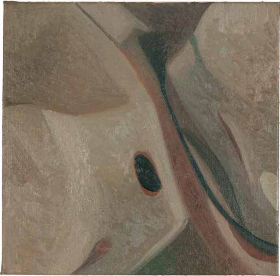
114 INKARNATIE , 2014 olieverf op linnen, 40 x 40 cm. collectie kunstenaar