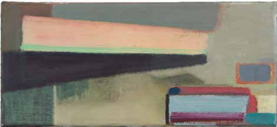
95 24-2 / 22-12, 2019 olieverf op paneel, drieluik, per stuk 19 x 40 cm. particuliere collectie