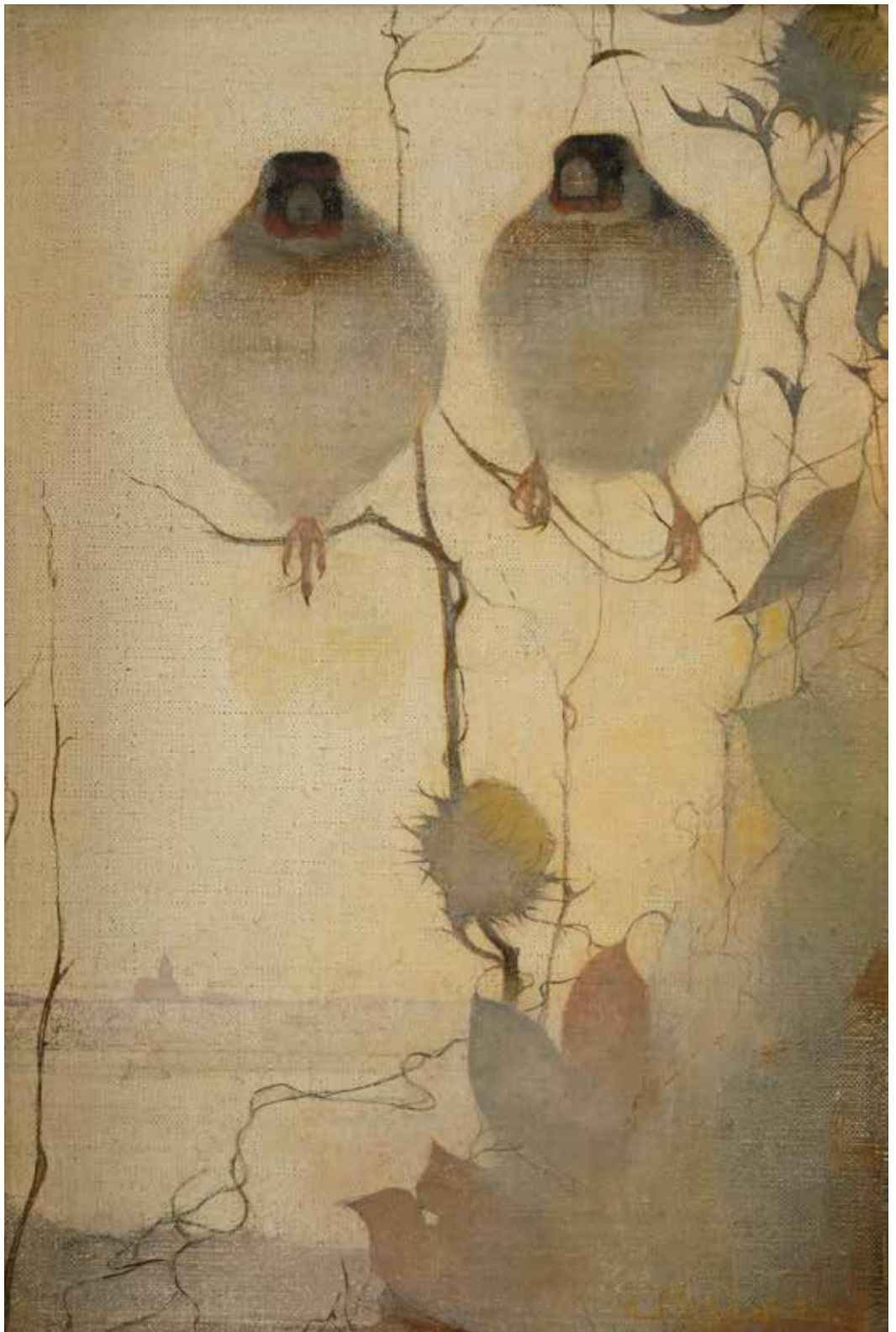
Jan Mankes (1889-1920) Putters in avondschemering , 1911 olieverf op doek, 18 x 12 cm