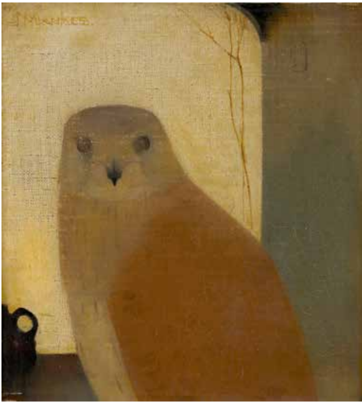
Jan Mankes (1889-1920) Torenvalk , 1910 olieverf op doek op paneel, 13 x 11,7 cm