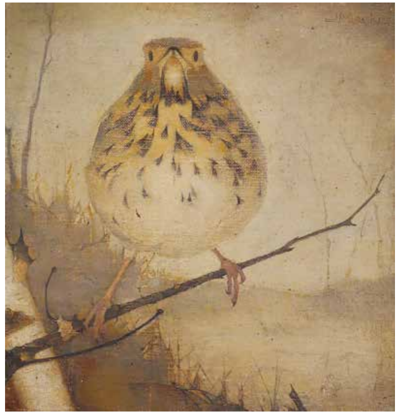
Jan Mankes (1889-1920) Lijster op tak , 1910 olieverf op paneel, 17,5 x 17 cm